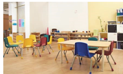
Exemplo de aplicação do BIOÁLAMO